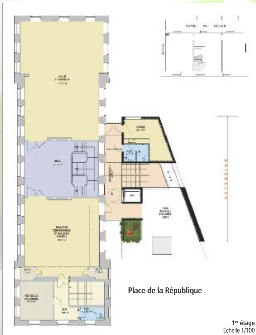
Place de la République

Cette solution s'accompagne de la démolition des actuelles toilettes publiques, ce qui ouvrira de nouvelles perspectives visuelles entre la rue de la 1 ère Armée et la rue Kléber, tout en mettant en valeur l'hôtel de ville et le poste de police.