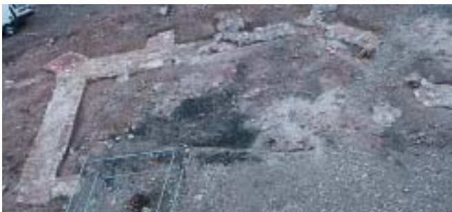
Fondations de la Chapelle Saint-Michel

Puis les fouilles se sont concentrées sur l'analyse précise d'une partie du cimetière. Sous la direction d'une anthropologue, l'équipe de l'INRAP a mis à jour minutieusement au pinceau une soixantaine de squelettes sur une zone de 10 mètres sur 10 seulement ! Une première étude, sur place, a permis d'étudier les rites funéraires thannois au moyen-âge. Les indices découverts permettent de conclure que nos ancêtres étaient ensevelis dans un linceul et déposés dans un cercueil, comme témoignent les agrafes retrouvées sur les torsos et les clous entourant les corps. Les squelettes sont en cours d'analyse à Strasbourg pour essayer de les faire parler. De quelles pathologies ont-ils souffert ? Quel métier pouvaient-ils exercer ? A quel âge sont-ils décédés ? Des questions auxquelles nous aurons bientôt des réponses.