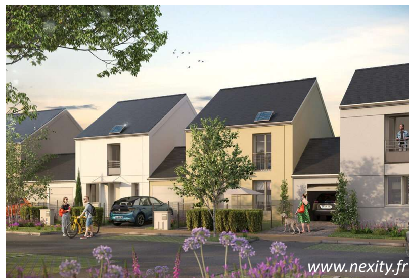
PV N°4 – Nexity Village